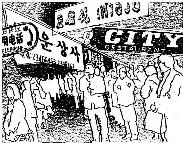
外国人が集中的に住む地域の現状を知ることが重要だ。イラスト・よしおか じゅんいち

これまで在日外国人に絡む問題は専ら地方自治体や地域住民、NPOに委ねられてきた。だが、地域レベルでの対応は限界にきている。移民を本格的に受け入れるかどうかは、実は将来どんな国を目指すのかという国家像にかかわる大問題だ。人材開国で成長を続け経済大国の地位を守るのか、人材鎖国のまま少子化対策に専念するのか。それとも人口減を受け入れ小国として生きるのか。どの道を選ぶにせよ、国家レベルの戦略と国民的議論が求められている。