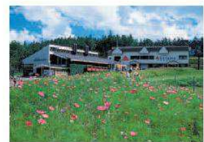
ゴンドラの駅周辺も美しい

切 り立った中部山岳地域と比べ、広く裾を引く山の多い東北。なかでも安達太良山は柔和な姿で知られ、日本百名山、花の百名山にも数えられている。高村光太郎の『智恵子抄』で「ご存じのかたも多いだろう。まさに東北の名山だ。非常に奥深い安達太良山だが、あだたらエクスプレスを使えば、眺望抜群の山頂駅(標高1350メートル)までわずか6分。体力的にも楽に登れる。紹介する安達太良山往復コースはゆるやかで歩きやすいうえ、春は新緑、初夏はシャクナゲなどが美しい。山頂駅近くの薬師岳バラパークは、安達太良山を一望できる好ポイントだ。山頂が近くと辺りの緑が消え、火山らしい荒々しい様相となる。山頂はもちろん好展望。吾妻連峰や磐梯山などを見渡せる。下山後、奥岳温泉・あだたら高原富士急ホテルでひと汗流すといい。